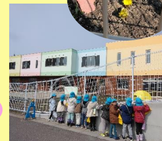
早く新しいこども園で遊びたいな～

折り紙で桜の花を作り2階の木につけたり、さくら組さんへのお別れのプレゼントを作ったりと制作をしました！プレゼント作りでは「さくらさん喜んでくれるかな？」「かわいく作ろう！」と思いを込めて作ることができましたよ！散歩では「春見つかるかな？」と歩いていくと小さなお花を発見！その後は電車を見に線路沿いを歩きました。電車が通り、手を振り終わると「新しいこども園の近くには電車はないよね！？」と少しさみしい表情を浮かべる姿も見られましたよ。