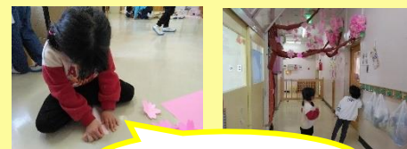
折り紙で桜を制作中

今月のテーマは春です。春についてサークルタイムで話をすると「春は雪が多くないよね！」「あたたかいと雪はとけるんだよね！」「葉っぱが見えるようになるよね」と戸外の様子が変化することを思い浮かべたり、「さくら組になるよ」「パッチの色も変わるね！」「小学生になるよね」と一つ大きくなることについて期待を膨らませたりと色々な話が出ました。