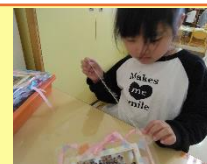
さくらさん喜んでくれるかなあ