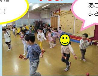
あこがれのよさこい…