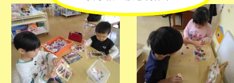
さくら組さんへお別れのプレゼントを作りました！