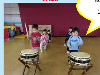
ほくたちもいい音出せてるよ！！