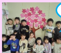
さくら組の木にも桜の花が咲きました！！