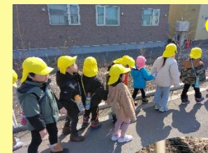
春探しの散歩に出発！