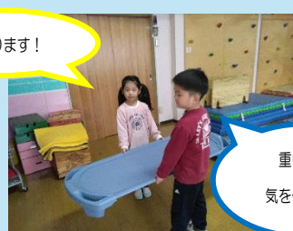
重いから気を付けてね